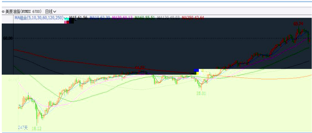
图 4：美原油指数走势-日线