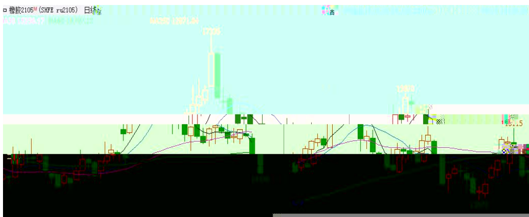
图 1：RU2105 走势-日线