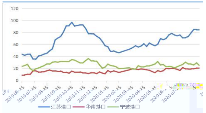
图 2: 口 存 势 单位: 万吨