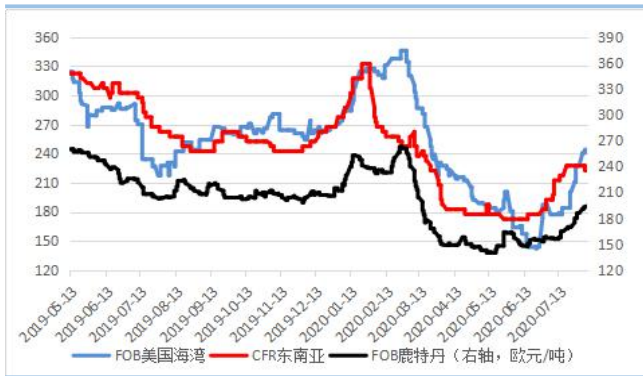
图 1: 外 围 价 单位: /