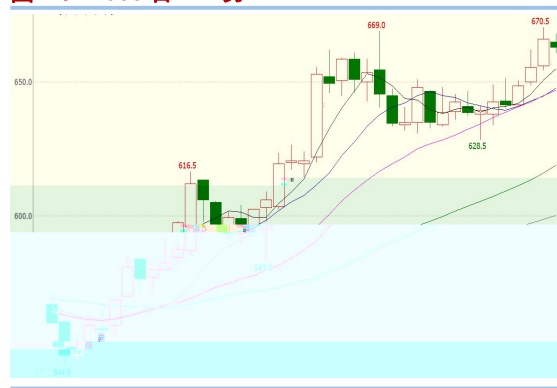
图 1: I2005 合 势