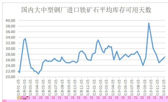
图 5：厂 库存可 天数 单位：天