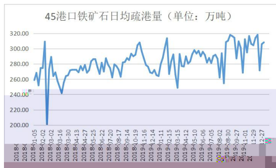
图 4：45 日均 单位：万吨